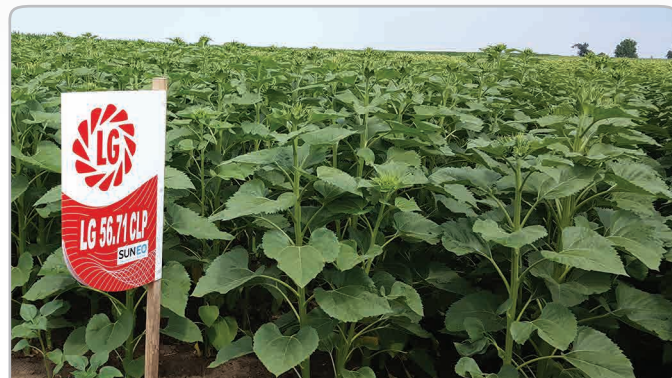
Посев с хибрид LG 56.71

Новата Clearfield Plus технология при слънчогледа на Лимагрейн е номер едно в стопанството на земеделския производител Пламен Генчев. Зърнопроизводителят отглежда зърнено-житни и маслодайни култури на площ от 24 хил. дка. Земята му е разпределена в няколко селища на Русенска област, като зърнената му база се намира в село Борисово. „70% от площите ми, заети със слънчоглед, са с хибриди на Лимагрейн. Преди повече от 10 години Пламен Генчев за първи път пробвал LG слънчоглед и засял LG 56.65, като бил очарован от хибрида. Конвенционалният LG 56.65 M хибрид вече 10 години е неотменна част от сеитбооборота на земеделския стопанин. „Изключително добре е адаптиран за условията на България. Притежава ненадмината стабилност в представянето и отлична продуктивност. И до днес работя с него, защото знам, че е стабилен във всяко едно отношение“, допълни Пламен Генчев.